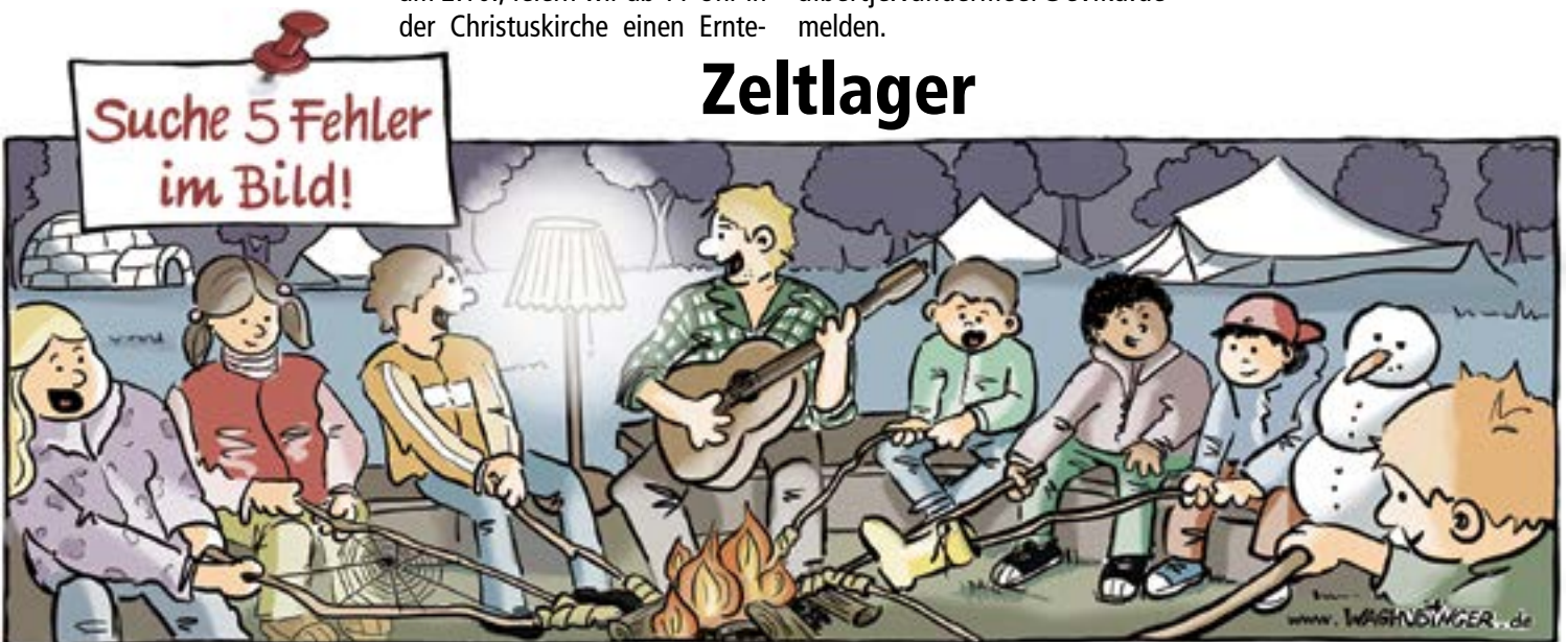
lglu, Spinnwebe, Lampe, Stiefel, Schneemann