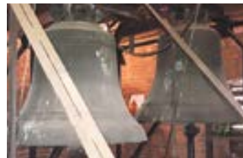
Beide Barrier Glocken.

Abendgeläut ersetzt Coronaläuten um 19 Uhr