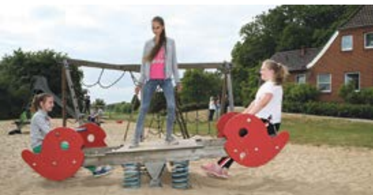
Drei Mädchen aus Gomel auf dem Gelände des Freizeitheims in Wöpsse 2019

In den Jahren bis 2019, vor Corona, kam im Sommer eine Kindergruppe aus einer Schule in Gomel in unseren Kirchenkreis, damit sich ihr gesundheitlicher Zustand verbessern und sie eine unbeschwerter Zeit erleben konnten. Die vier Wochen im Freizeitheim Wöpsse waren zu-