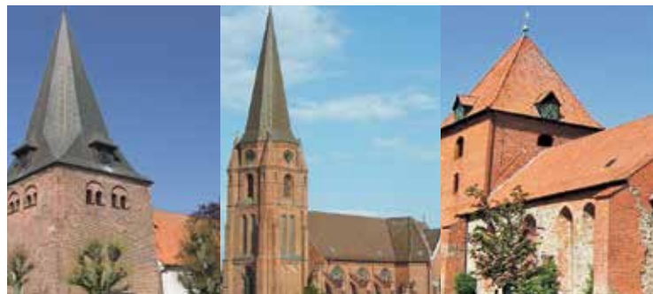
A = Abendmahl T = Taufgottesdienst